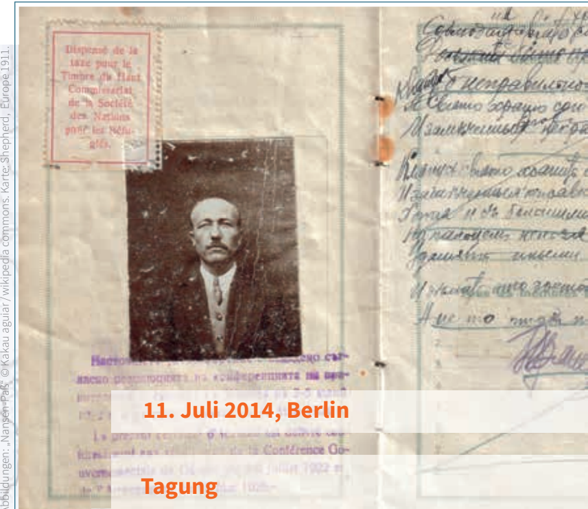
Abbildungen: „Nansen-Paß“ © Kakau aguiar / wikipedia commons. Karte: Shepherd, Europe 1911.