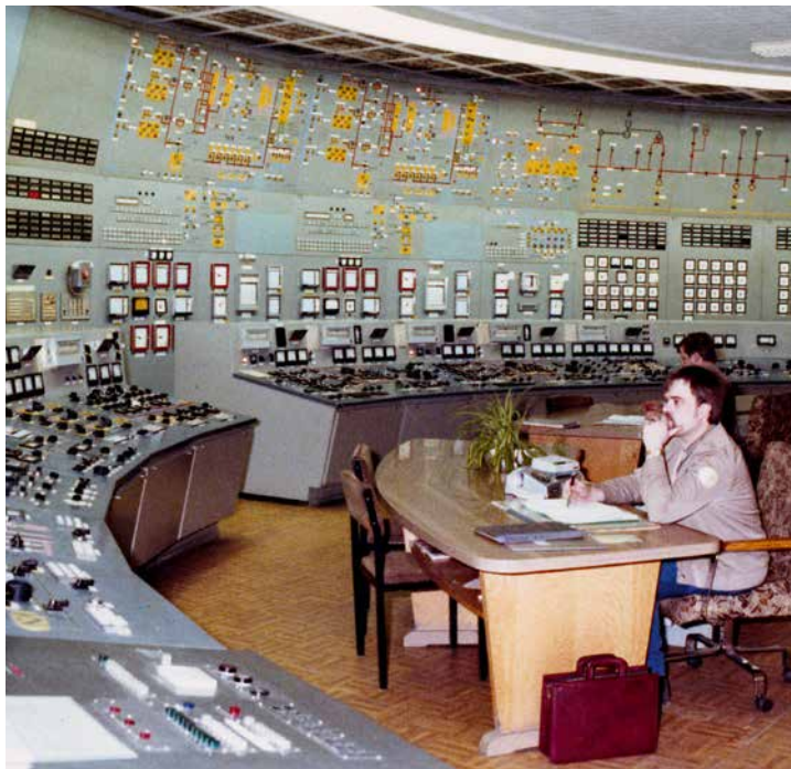
Kontrollraum des Kernkraftwerks Lubmin ca. 1987

„Tschernobyl wirkt überall“ – unter diesem Leitsatz protestierten nach der Reaktorkatastrophe im Jahr 1986 immer mehr Menschen gegen die desolante Umweltpolitik der SED. Bereits in den frühen 80er Jahren hatten sich angesichts der verheerenden ökologischen Bilanz der DDR unabhängige Umweltgruppen formiert. Tschernobyl bewirkte eine zusätzliche Mobilisierungswelle und damit das weitere Erstarken der Ökologiebewegung. So gerieten die Umweltgruppen zunehmend ins Visier der Stasi. Argwöhnisch verfolgte die Staatssicherheit die ökologisch motivierten Aktivisten, hörte Telefongespräche mit, montierte Abhörenanlagen und setzte Spitzel ein.